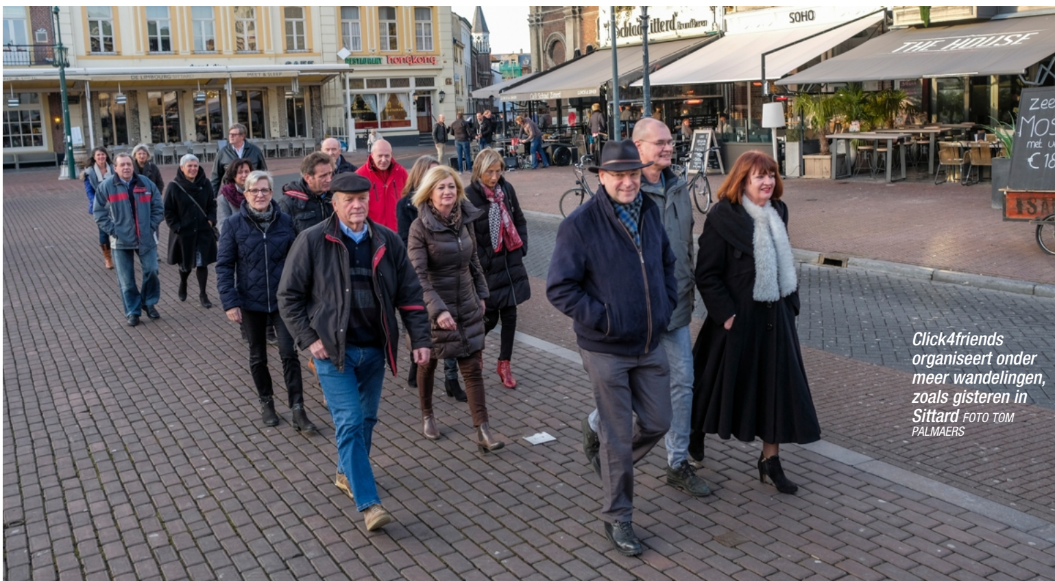
Click4friends organiseert onder meer wandelingen, zoals gisteren in Sittard.